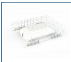
Защитная решетка Луна (300*200*70)